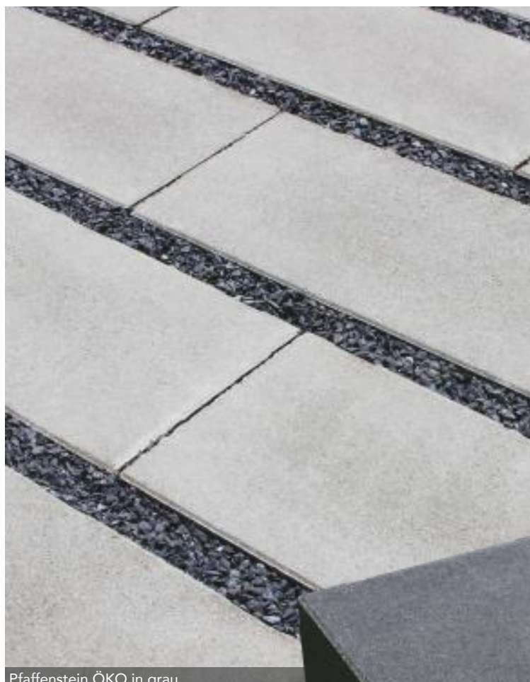
Pfaffenstein ÖKO in grau