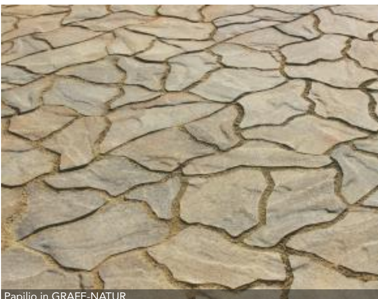
Papilio in GRAFE-NATUR

Die außergewöhnliche Form unseres Gestaltungspflasters Papilio macht jede verlegte Fläche zu einem Unikat. Das durchdachte System mit den enthaltenen Randsteinen ermöglicht eine unkomplizierte Verlegung und verleiht der Fläche eine natürliche, aber dennoch unverwechselbare Optik. Nur Kenner wissen, dass die Steinform ursprünglich an eine Blume erinnert.