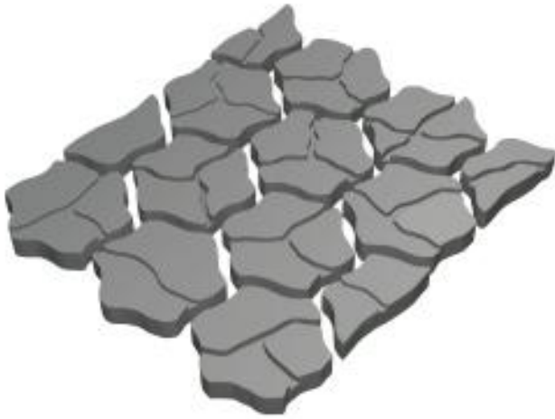
Papilio · Anordnung einer Lage Nur als Lage verkäuflich.