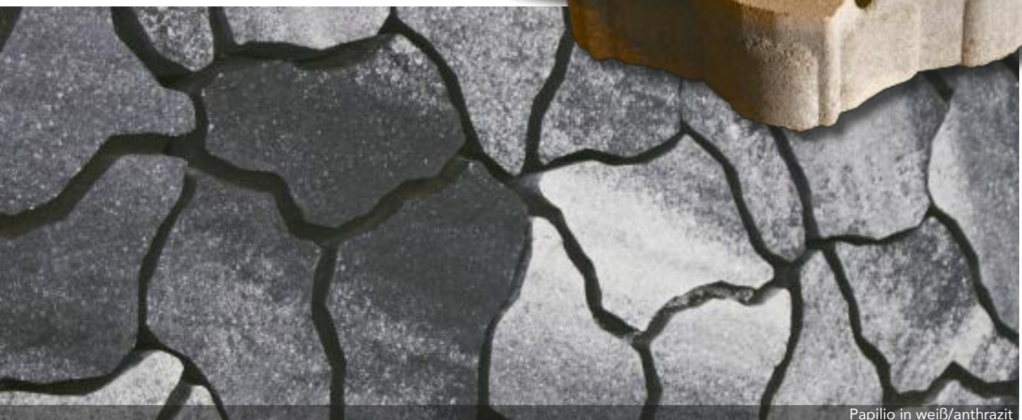
Papilio in weiß/anthrazit